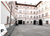
Erster Hof für das Salzburg Museum.